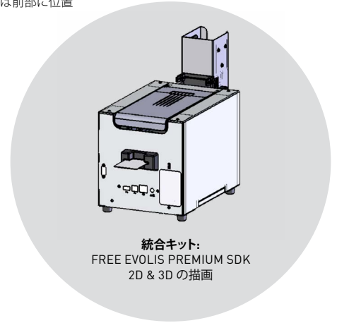
統合キット: FREE EVOLIS PREMIUM SDK 2D & 3D の描画